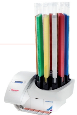
PrintMate AS Kassettendrucker Geringe Stellfläche für Druck direkt im Zuschnitt