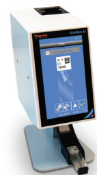
SlideMate AS Objektträgerdrucker Druck direkt auf den Objektträger Verringert die Fehlerwahrscheinlichkeit und optimiert den Ablauf

Bitte sprechen Sie uns an: Tel. 06103-4081232