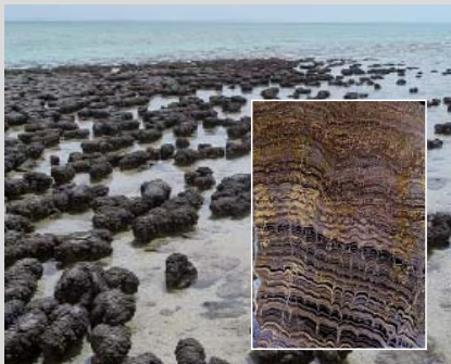
Stromatolithen in Australien.

Stromatolithen sind geschichtete Kalkausfällungen, die in Sedimentgesteinen als Folge mikrobieller Photosynthese auftreten (kleines Bild). Die ältesten derartigen Formationen sind 3,5 Milliarden Jahre alt, doch auch heute noch findet man in ökologischen Nischen mit extrem salzhaltigem Wasser Bakterienkolonien, die solche Kalkschichten bilden.