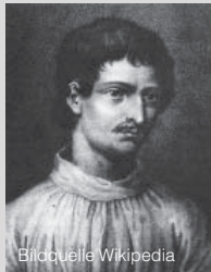
Biobuella Wikipedia Giordano Bruno 1548 – 1600

klagte ihn die Inquisition der Gotteslästerung an, weil sein Weltbild keinen Platz für das Jenseits und keinen Zeitpunkt für das Jüngste Gericht vorsah. Hinzuzufügen wäre, dass in diesem Weltbild auch der Urknall keinen Platz hätte. Giordano Bruno wurde nach acht Jahren Kerker in Venedig auf dem Scheiterhaufen verbrannt.