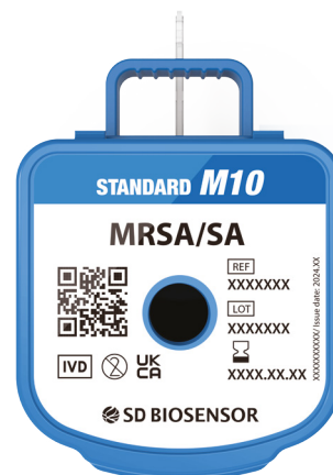
STANDARD™ M10 MRSA/SA