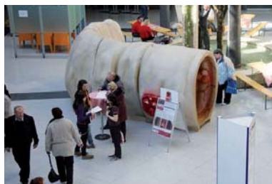
Krebsvorsorge zum Anfassen: Ein begehrtes Modell des Dickdarms.

vom Bundesverband der Verbraucherzentralen forderte Qualitätskriterien der Patienten (Patient Reported Outcomes), ergänzende Hintergrundrecherchen, redaktionelle Betreuung und Transparenz (z.B. HON-Zertifizierung im Internet, HON=Health On the Net Foundation) für öffentliche Vergleiche medizinischer Versorgungsqualität.