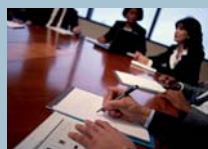
Management & IT