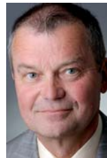
Prof. Dr. med. Georg Hoffmann Herausgeber

Fordern Sie ein Probeabonnement Online unter www.trillium-report.de an (Menüpunkt Bestellung ).