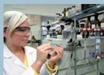
Medizin & Life Science