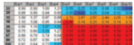
Clustering der Daten: Man erkennt zwei Klassen von Experimenten (Spalten) und drei Klassen von Genen (Zeilen) mit unterschiedlichem Verhalten bei frühen und späten Tumorstadien.