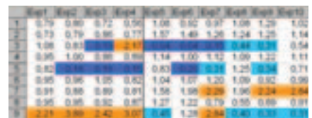
Transformierte Originaldaten: Jede Zeile repräsentiert ein Gen, jede Spalte ein Experiment. Alle Signale wurden durch ein normales Referenzsignal dividiert. Ein Wert von 1,00 entspricht somit einer normalen Expression. Blaue und rote Farben markieren unter- und überexprimierte Werte.

Komplette Datenanalyse für 10 Genexpressions-Experimente mit insgesamt 100 Sonden von der Transformation der Rohdaten über das Clustering bis zum Training eines künstlichen Neuronalen Netzes mit korrekter Reklassifizierung früher und später Tumorstadien.